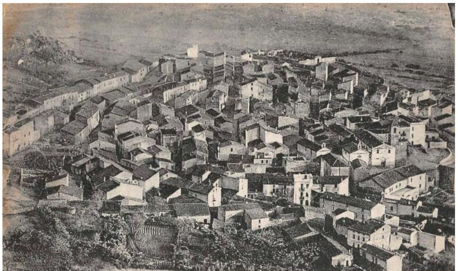
Panorama di Berchidda (Sardegna)

La divisione si fece da pochi anni, e già i lotti si vanno concentrando nelle mani di pochissimi, perché la maggior parte dei cittadini, impotenti a pagare le gravi imposte, cedono a vil prezzo i lotti che erano stati loro assegnati. Così la piccola proprietà, economicamente tanto utile, va gradatamente scomparendo.