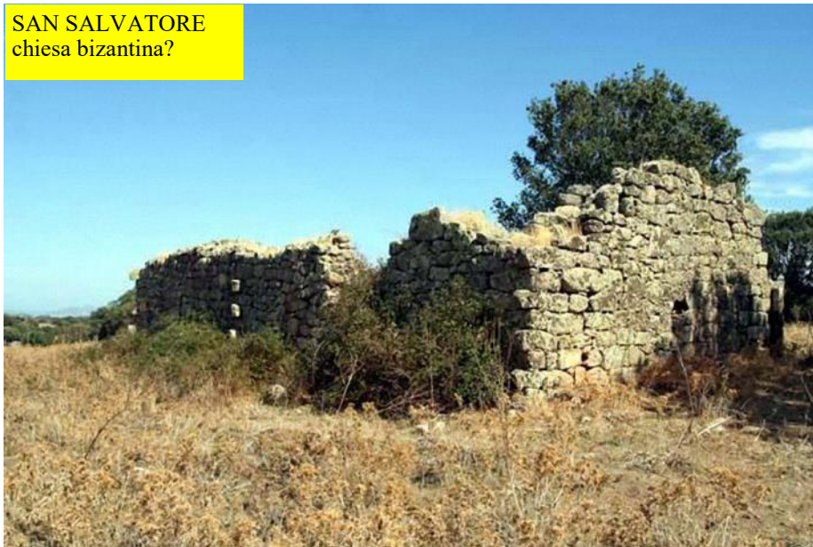
SAN SALVATORE chiesa bizantina?

La Relazione (pp.256-260) cita numerosi villaggi (a volte solo piccolissimi insediamenti) con i nomi di alcuni dei rispettivi abitanti: